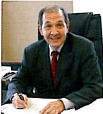
La Chaix est aujourd'hui présidée par Pierre-Marie Bonaccorsi

Le prochain conseil d'administration du groupe, début mars, devrait valider cette cession de la banque dont le siège est aujourd'hui à Avignon. HSBC a pris le contrôle de la Chaix, via le CCF, en 2000.